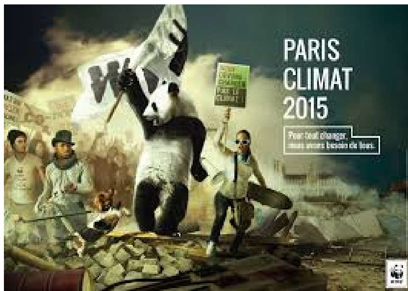
La Pandarévolution, campagne de publicité de WWF pour la COP21 (2015)